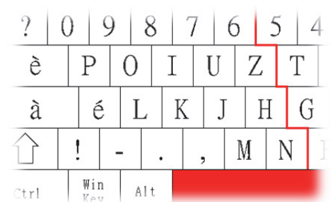
Clavier B-Key en mode bascule